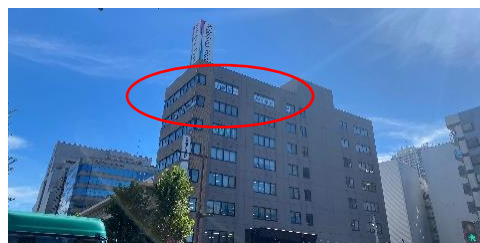
事務所外観（赤マル内の2フロア）