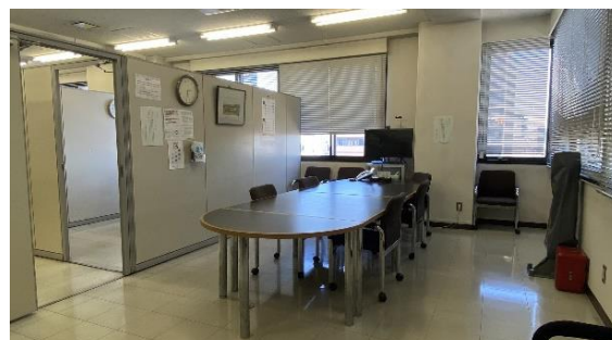
7階相談室（相談室は大小合わせて全6室）