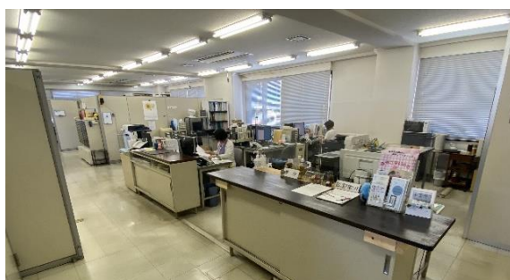
7階受付（弁護士の執務スペースは8階）