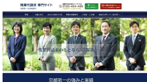
残業代専用ホームページ