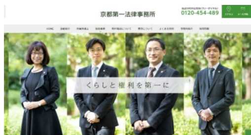
事務所ホームページ